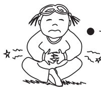
mal de ventre