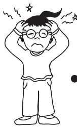
mal de tête